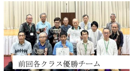
前回各クラス優勝チーム